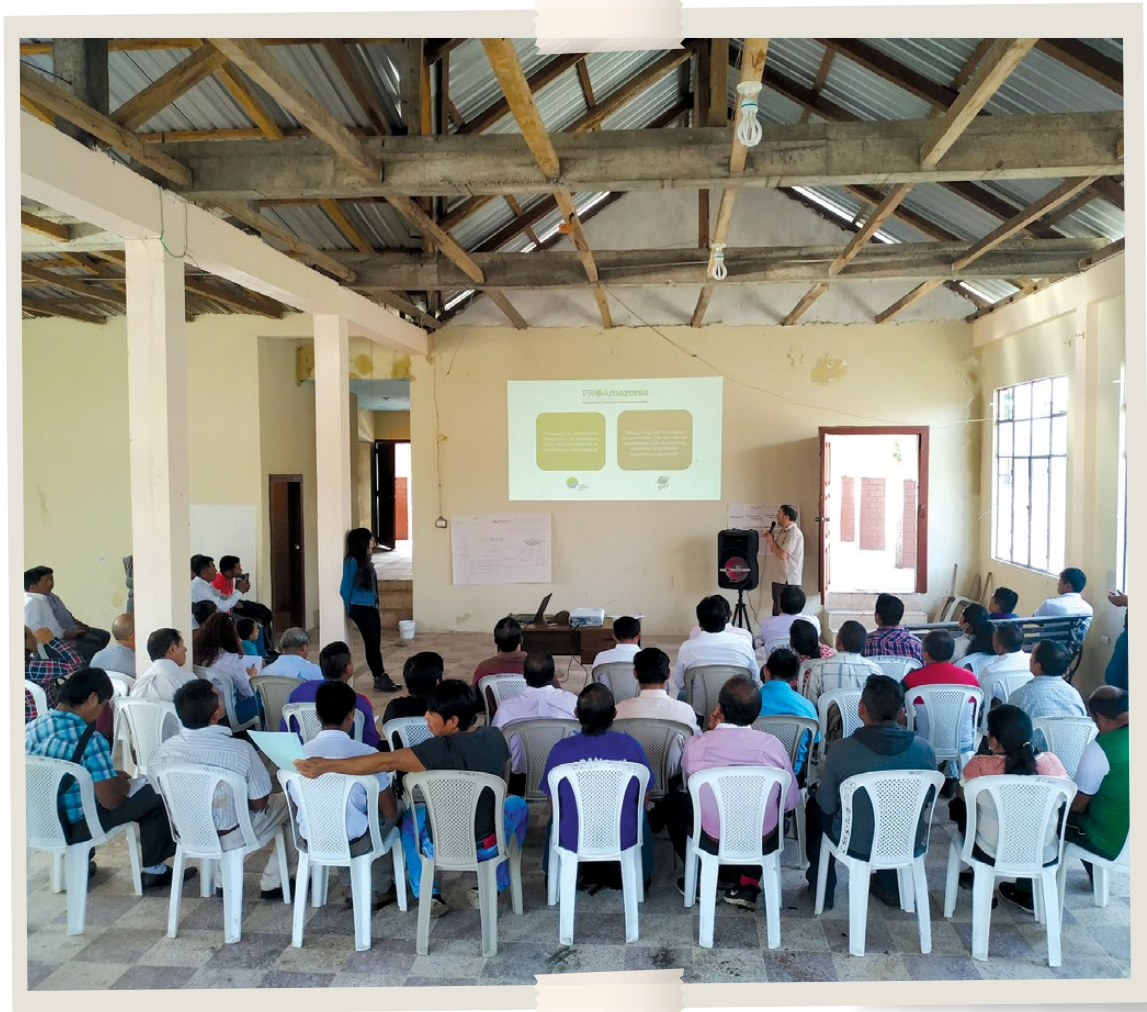
Proceso de Consulta Previa Libre e Informada a la Asociación de Centros Shuar Sevilla Don Bosco. Aprobación en Asamblea del inicio del proceso de formulación del Plan de Vida con el apoyo de MAG-MAATE-CONFENIAE-PROAmazonía (25/08/2019).