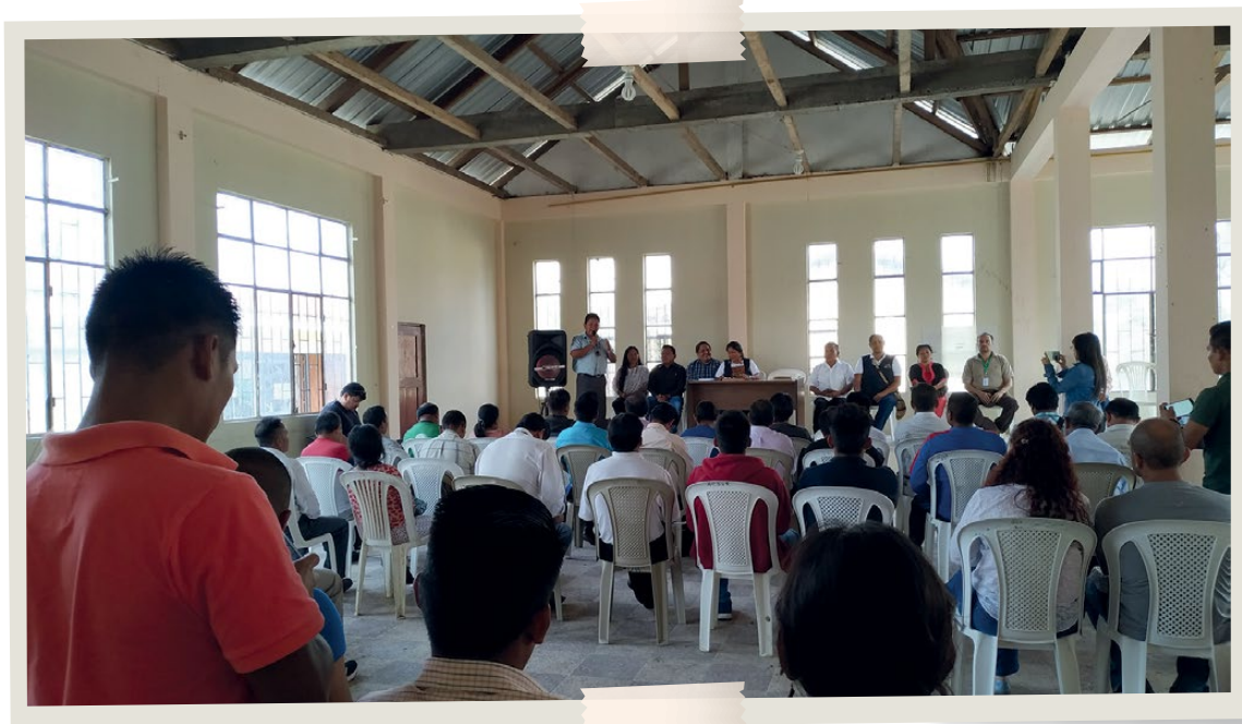
Proceso de Consulta Previa Libre e Informada con la Asociación de Centros Shuar Sevilla Don Bosco, en la cual se aprobó en asamblea el inicio del proceso de formulación de su Plan de Vida con el apoyo de MAG-MAATE-CONFENIAE-PROAmazonía (25/08/2019).

En cuanto al uso y resguardo de información se acordó obtener datos relevantes de cada comunidad los mismos que debían reposar únicamente en la Asociación. Se acordó que, para que la participación de hombres, mujeres y sabios sea equitativa y representativa de las comunidades socias, se debía invitar a 3 delegados por comunidad: un hombre, una mujer y un adulto mayor a participar en cada taller.