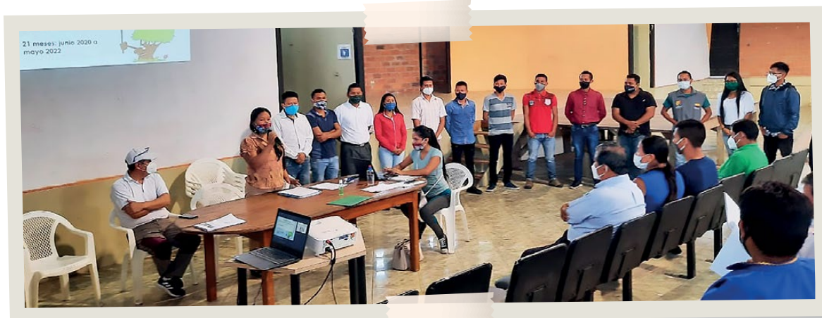
Socialización de Proyecto de Restauración con PKR - Napo, 2020.