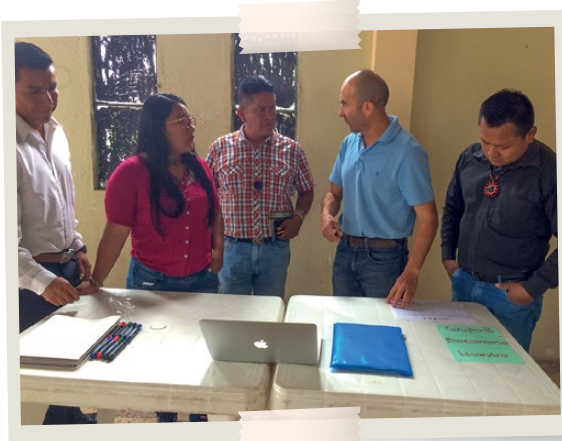
Los miembros de la Asociación de Centros Shuar Sevilla Don Bosco analizan sus problemas y buscan las soluciones adecuadas a su cosmovisión y sueños de futuro.