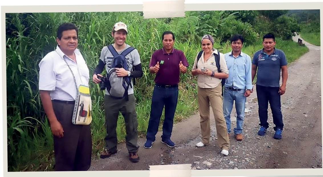
Visita de Campo - Napo, 2018.

Con esto se logró formalizar esta iniciativa a través de una reunión que se realizó en Quito a finales de 2018 en la que participaron MAATE- PNR, PROAmazonía, PKR y TNC. Esta primera reunión tuvo como objetivo establecer acuerdos y analizar las posibilidades de trabajar conjuntamente en procesos de restauración.