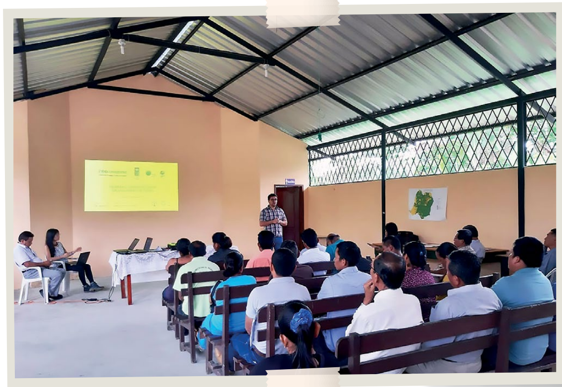
CPLI a delegados de comunidades de PKR - Napo, 2019.

Este proceso se denomina como micro evaluación 8 , y es parte de la política del Programa de las Naciones Unidas para el Desarrollo (PNUD) para garantizar el buen uso de los recursos.