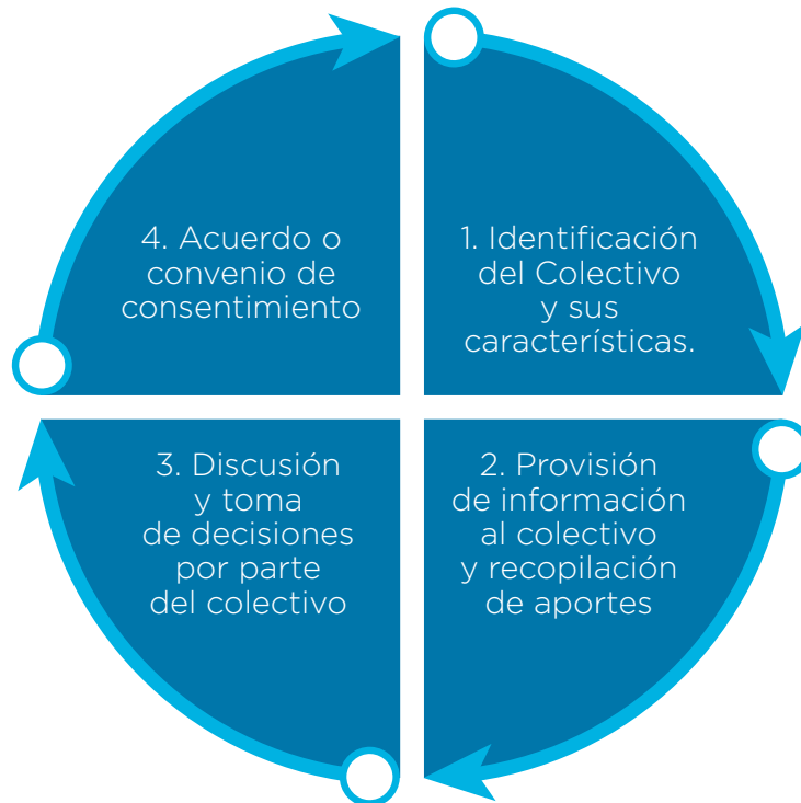
Imagen 1. Pasos mínimos de la Consulta Previa Libre e Informada (CPLI) para REDD+.

Este documento fue desarrollado con la asistencia técnica del programa ONU REDD y del Alto Comisionado de Naciones Unidas en Derechos Humanos que sugiere guiarse en una serie de pasos para realizar la Consulta Previa Libre e Informada (CPLI) en la implementación de medidas y acciones REDD+ (Imagen 1).