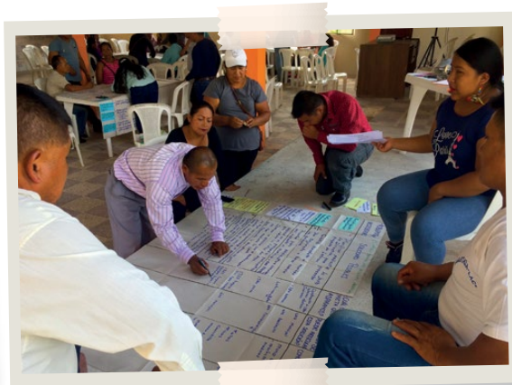
Talleres en Asamblea con los Síndicos y delegados de las Comunidades de la Asociación SDB.

Se presentaron las principales problemáticas y necesidades planteadas a la fecha en los diferentes centros, cada uno con sus posibles soluciones.