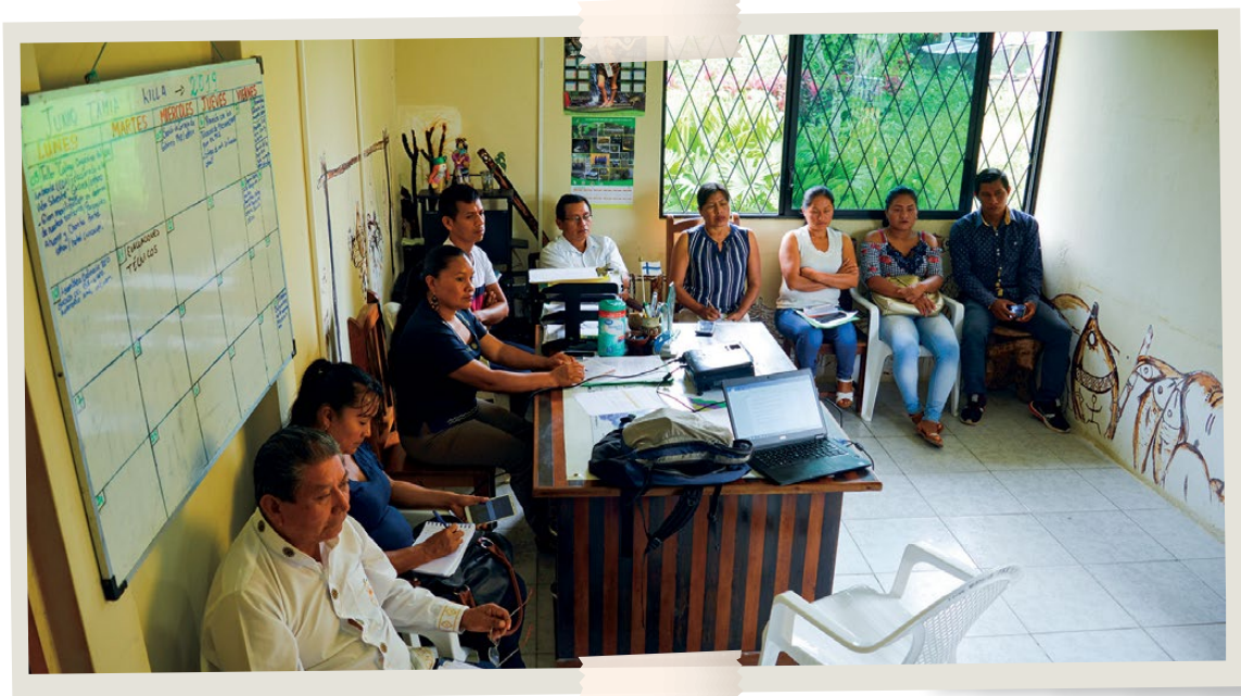
Priorización de líneas de acción de PKR - Napo, 2019.

que los productos sean procesados y exportados desde el territorio al consumidor, así como la conformación del equipo de trabajo interno de PKR, a través de profesionales y bachilleres jóvenes (hombres y mujeres) para que formen parte de este proyecto. PKR consideraba que, esta era una oportunidad para que los jóvenes del territorio puedan fortalecer sus conocimientos y experiencias.