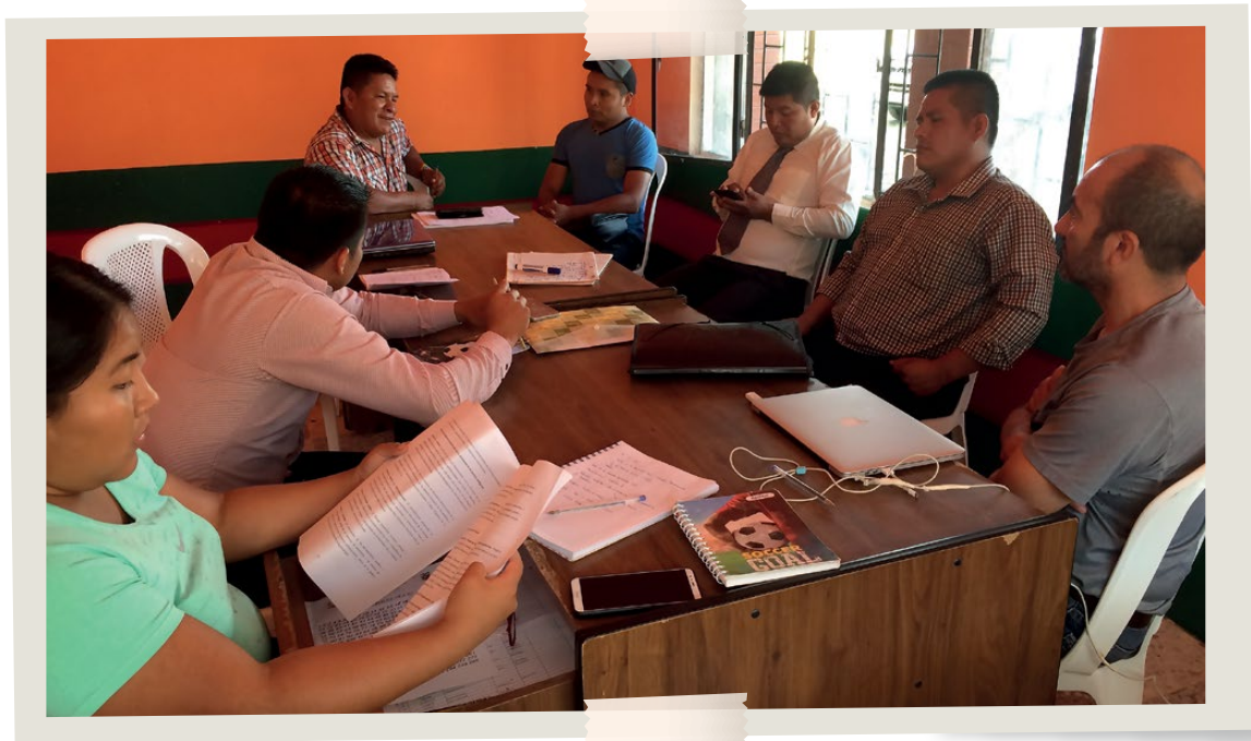
Reunión con la Dirigencia de la Asociación Sevilla Don Bosco previa a los procesos de CPLI.

En este encuentro se reforzaron los vínculos entre los 5 elementos orientativos elaborados por CONFENIAE y la metodología de trabajo a implementarse en 5 talleres para la formulación del Plan de Vida.