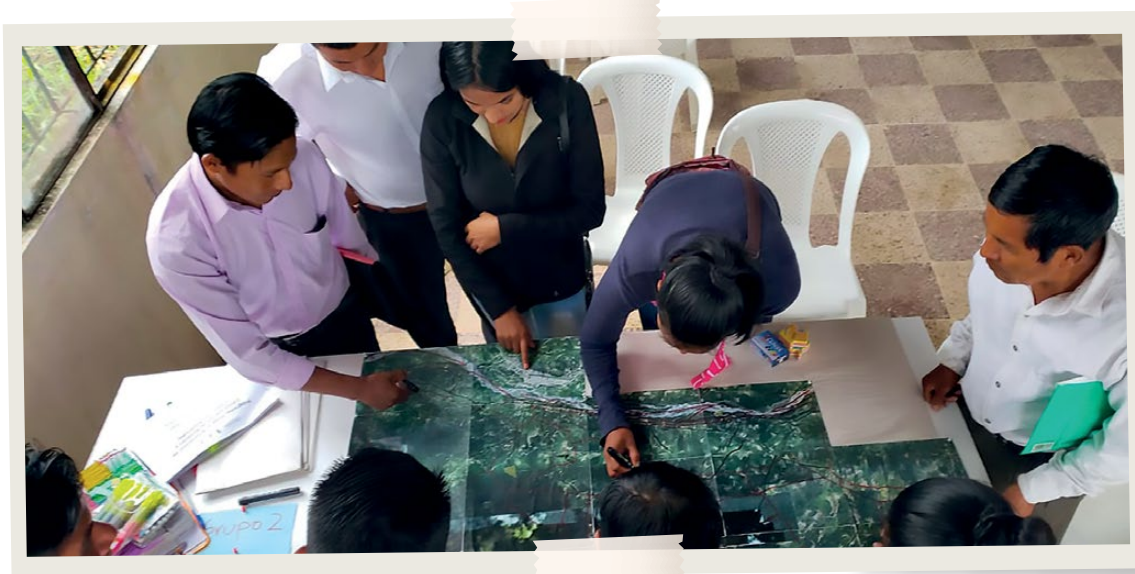
Primer Taller en Asamblea de formulación de su Plan de Vida (24/09/2019).

A esta fecha ya se había consolidado el primer documento borrador del Plan de Vida, por lo que el 14 y 15 de enero de 2020 se revisaron y validaron los contenidos de este primer documento, con la participación de los socios y síndicos de los centros. Se realizaron dos reuniones en las comunidades de Santa Clara y San Luis para revisar los hallazgos encontrados en cada una de las líneas estratégicas enmarcadas en los 7 elementos orientativos para la elaboración de Planes de Vida.