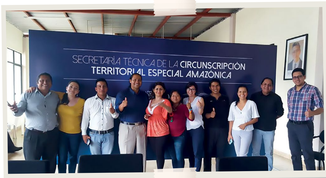
Reuniones iniciales del proceso para definición de áreas para el desarrollo de Planes de Vida con la ST-CTEA y CONFENIAE, Puyo, 2019.

La principal observación generada a las propuestas por parte de las Federaciones, fue que los criterios orientativos elaborados por CONFENIAE contenía 5 elementos que eran afines a la visión de las nacionalidades sobre los principios que debían direccionar la planificación y construcción de su Plan de Vida: