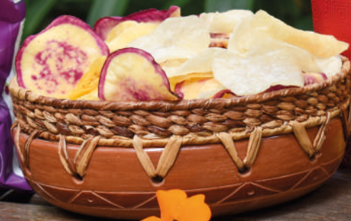
WANYA SNACKS AMAZÓNICOS Varias presentaciones