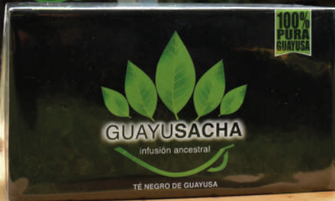
GUAYUSACHA TÉ DE GUAYUSA Varias presentaciones