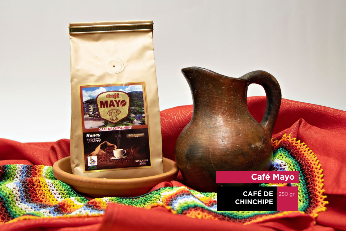
Café Mayo CAFÉ DE CHINCHIPE 250 gr