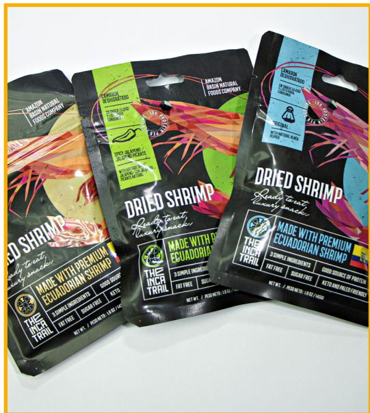
Aroma Nacional Camarón deshidratado 145gr