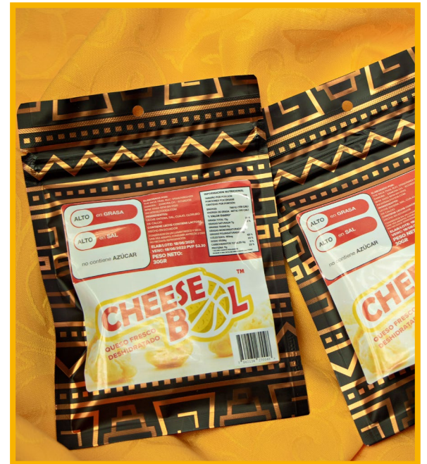
Cheese Bol QUESO DESHIDRATADO 30 gr