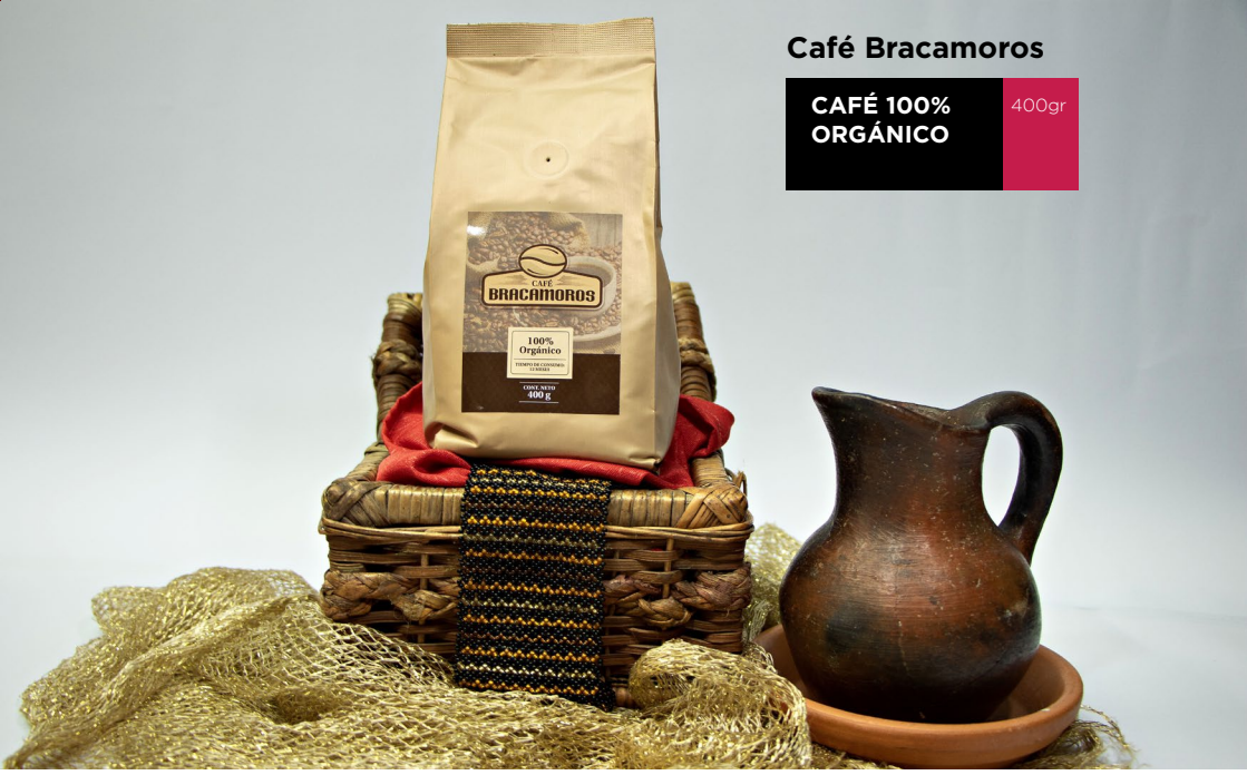
Café Bracamoros CAFÉ 100% ORGÁNICO 400gr

Productos de Zamora Chinchipe disponibles durante noviembre y diciembre de 2021