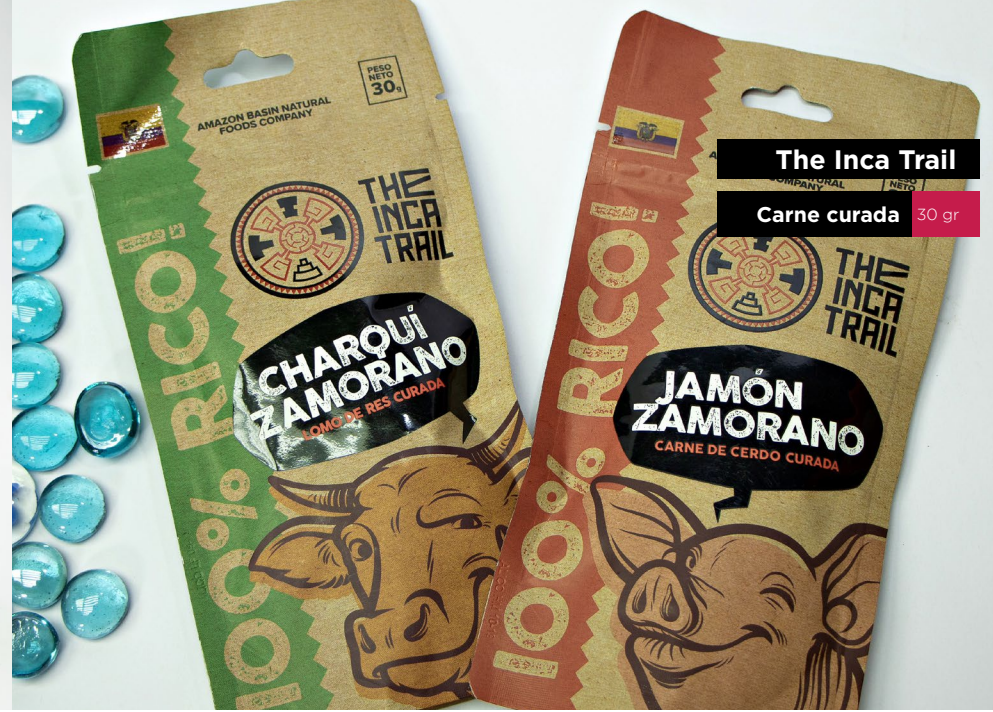
The Inca Trail Carne curada 30 gr