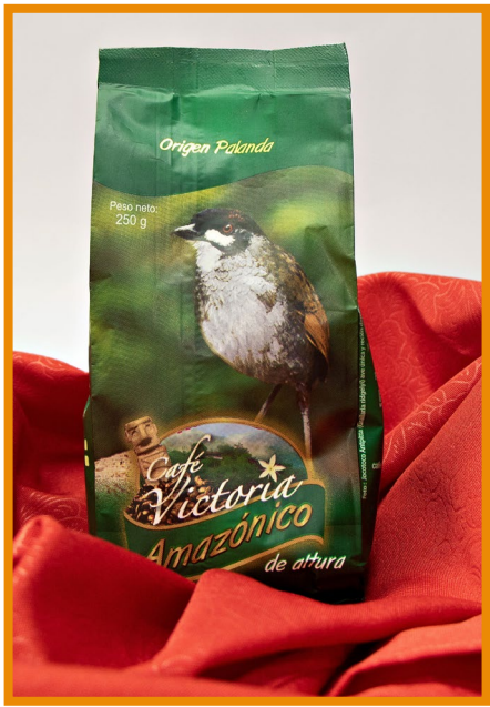
Café Victoria CAFÉ AMAZÓNICO DE ALTURA 250gr

Productos de Zamora Chinchipe disponibles durante noviembre y diciembre de 2021