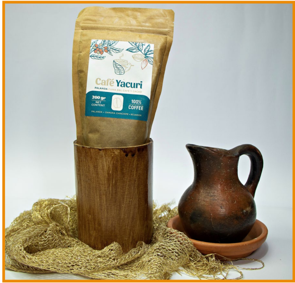
Café Yacuri CAFÉ MOLIDO 200 gr