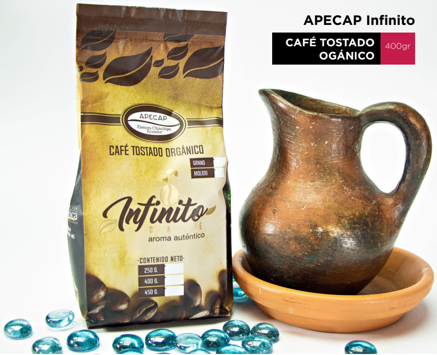
APECAP Infinito CAFÉ TOSTADO ORGÁNICO 400gr